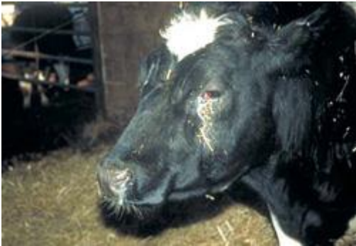
Kreatur med akut øjenbetændelse

Under et sådant forløb er det vigtigt at kunne få støtte og hjælp til praktiske ting. Kontakt gerne SEGES' veterinære beredskab for Kvæg .