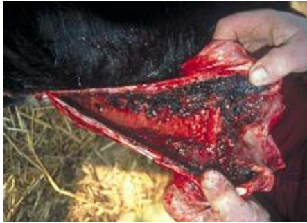
Luftrøret hos et dyr med akut IBR er blevet skåret op, og der ses blødninger som følge af sygdommen.